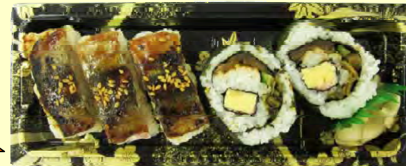
押し寿司&高菜太巻セット