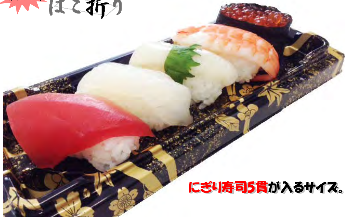
にぎり寿司5貫が入るサイズ。