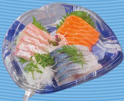
C-AP旬花 21-18 水筆B