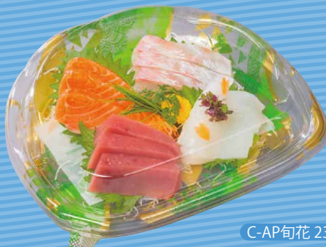
C-AP旬花 23-21 みすみGN