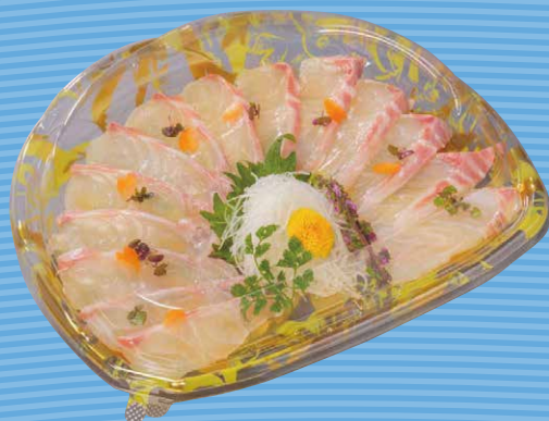
C-AP旬花 26-22 ふうかY