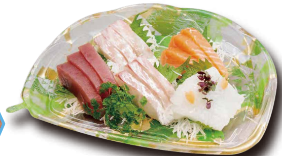
お刺身五点盛り C-AP 旬花23-21 みすみGN