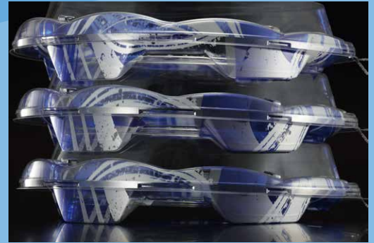
安心の積み重ねと、すっきり広い蓋が特徴です。

半月型のシルエットと、底面のリブでさまざまな盛り方を実現 底面には盛り付け方や点数を制限することの無いリブを設けました。 形状と機能がどんな盛り付けにも対応できる優れた汎用性を生み出します。