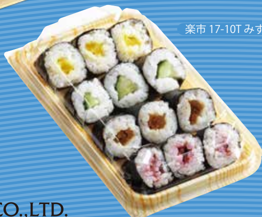
楽市 17-10T みずきY