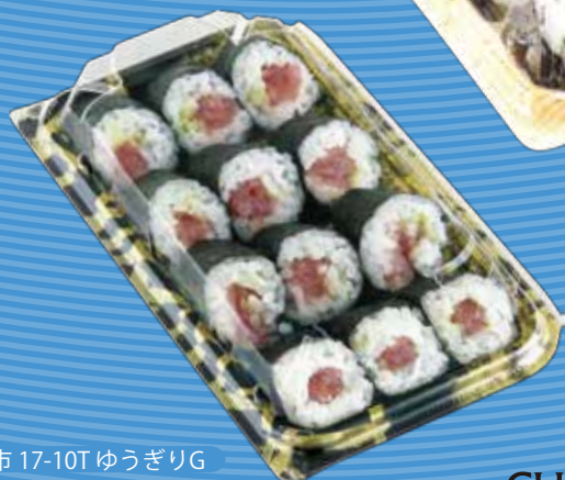
楽市 17-10T ゆうぎりG