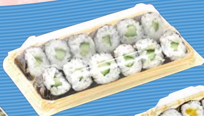
楽市 17-10 みずきY