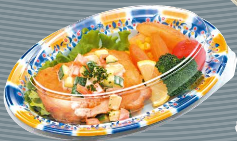
CT沙楽 M24-16 ベリー-BY