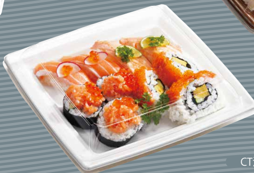
CT沙楽 K23-23 W