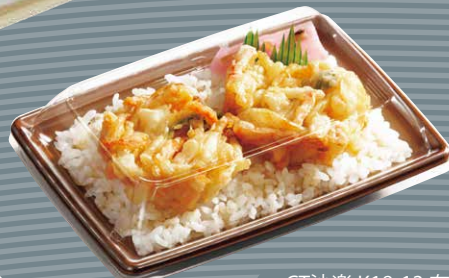
CT沙楽 K18-13 有明BR