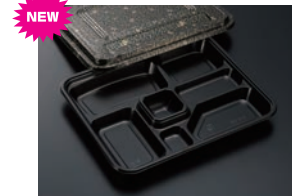
HS仕切 28 黒-花小舞 (共)