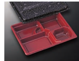
HS仕切 34 赤-花小舞 (共)