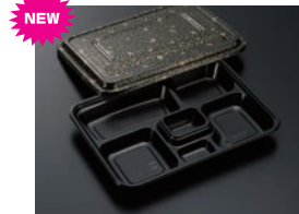
HS仕切 27 黒-花小舞 (共)