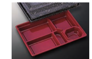
HS仕切 37 赤-花小舞 (共)