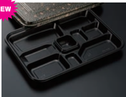
HS仕切 29 黒-花小舞 (共)