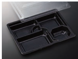
HS仕切 34 黒-花小舞 (ボ)