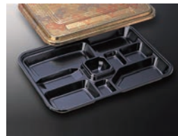
EX仕切 29 菊 (共)