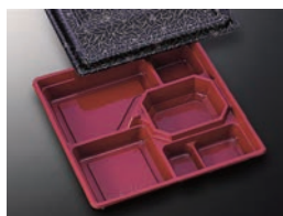
HS仕切 35 赤-花小舞 (共)