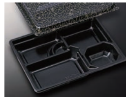
HS仕切 34 黒-花小舞 (共)