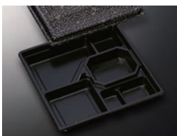
HS仕切 35 黒-花小舞 (共)