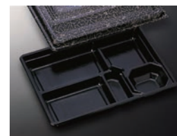
HS仕切 37 黒-花小舞 (共)