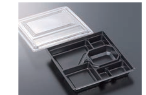
HS仕切 35 黒-花小舞 (ボ)