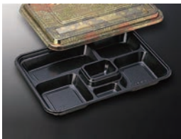
EX仕切 27 菊 (共)

●HIPS/ポリスチレン PSの耐衝撃性を改良した素材です。 耐熱温度90℃。レンジ・オープン不可。