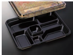
EX仕切 28 菊 (共)