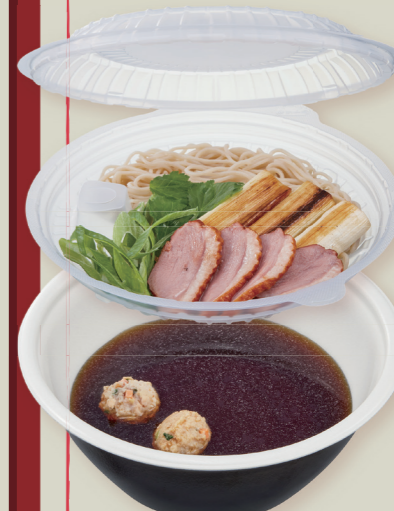
TP めん鉢 M20 IV- 黒 / 中皿フタ