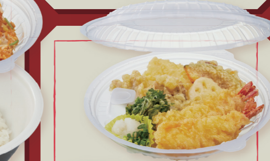
TP めん鉢 M20 IV / 中皿フタ