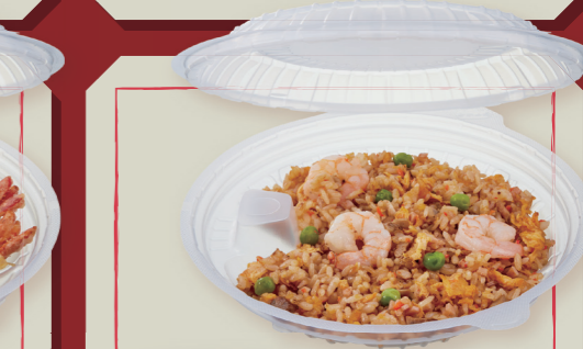
TP めん鉢 M20 黒両 / 中皿フタ