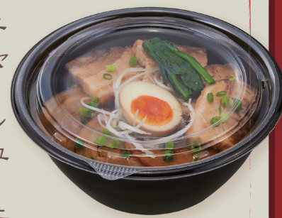
TP めん鉢 M18 黒両 / 蓋