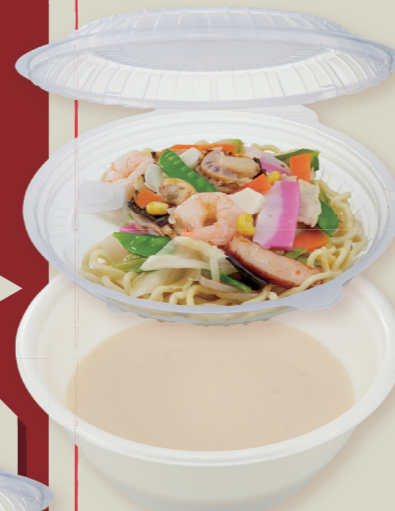
TP めん鉢 M20 IV / 中皿フタ