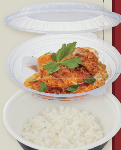
TP めん鉢 M20 IV- 黒 / 中皿フタ