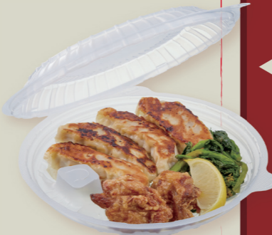
TP めん鉢 M20 中皿フタ