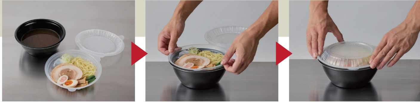
本体にスープ、中皿フタに麺・具材を盛り付ける