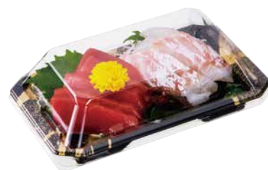
HS 澄板 18-11 金継 BK-BK