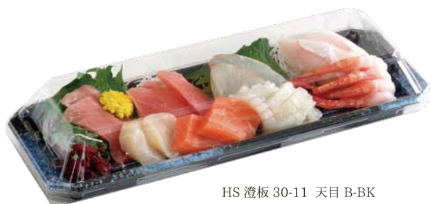
HS 澄板 30-11 天目 B-BK