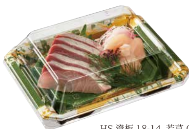
HS 澄板 18-14 若草 GN-BK