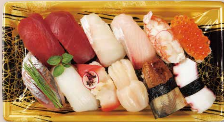
豪華にぎり 鮮鋭 12-2 ことほぎ BK