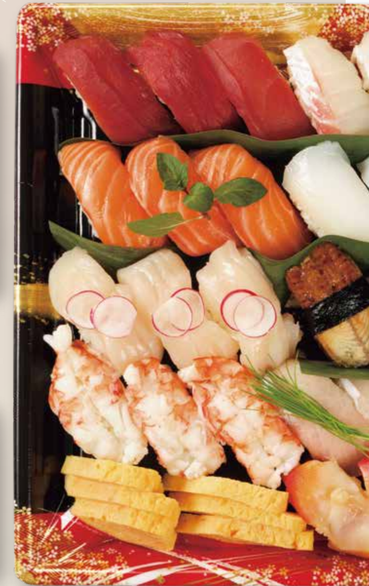
にぎり 30貫 鮮鋭 30-5 織り帯 R