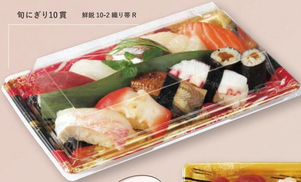
旬にぎり10貫 鮮鋭 10-2 織り帯 R