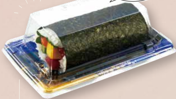
恵方巻ハーフ 鮮鋭 3-1 織り帯 B/高蓋 ※高蓋は 3-1/5-1 サイズのみ