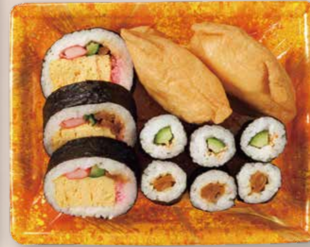
助六寿司詰め合わせ 鮮鋭 6-2 スパークル OR