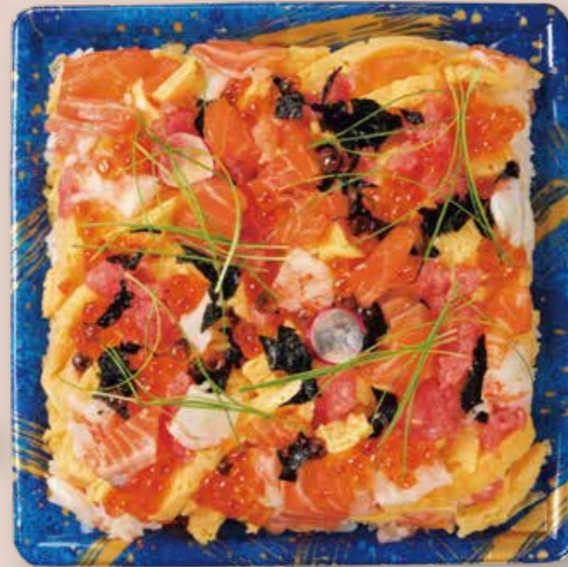
海鮮ばらちらし 鮮鋭 9-3 スパークル B