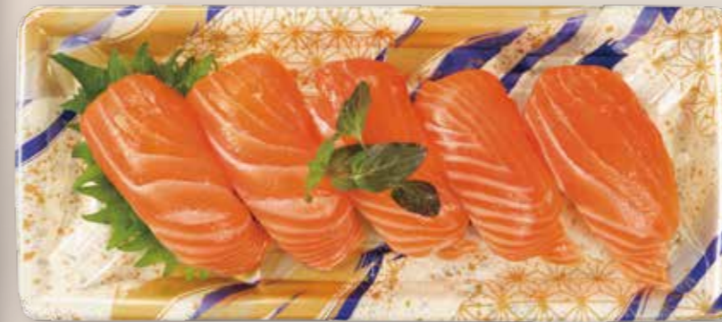
サーモン尽くし 鮮鋭 5-1 ゼファー IV