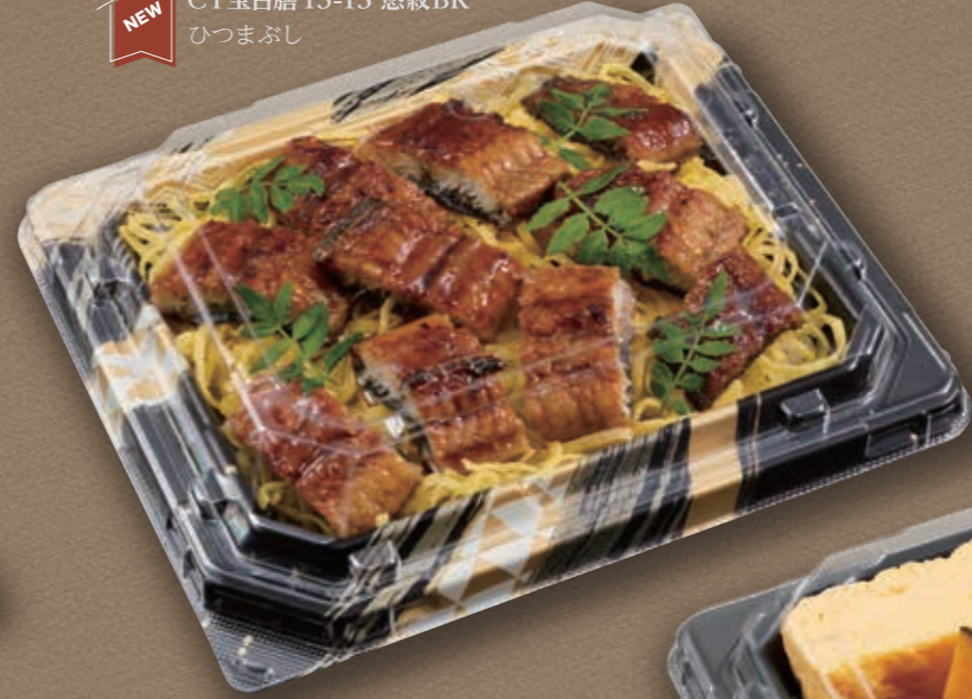
NEW CT宝台膳 15-13 悠紋BK ひつまぶし