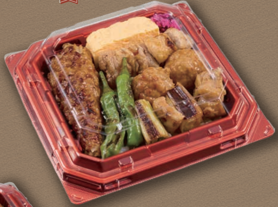
NEW CT宝台膳 K14 メタDR 焼き鳥つくね丼(小)