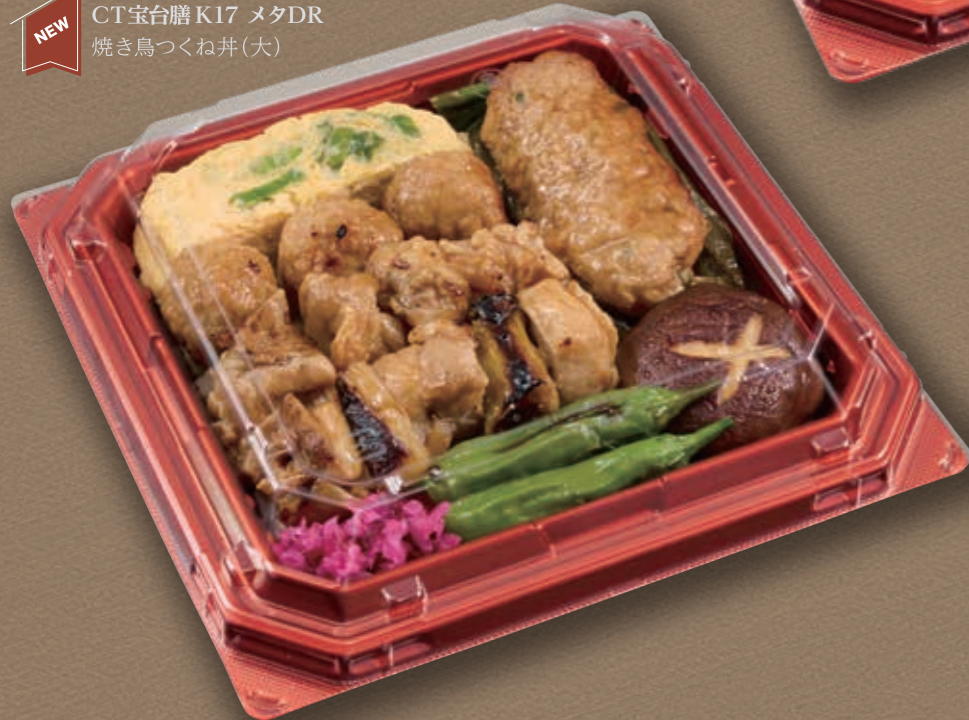
NEW CT宝台膳 K17 メタDR 焼き鳥つくね丼(大)