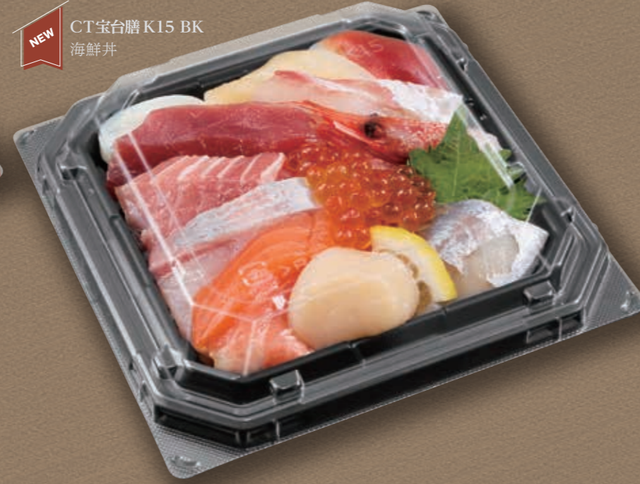
NEW CT宝台膳 K15 BK 海鮮丼