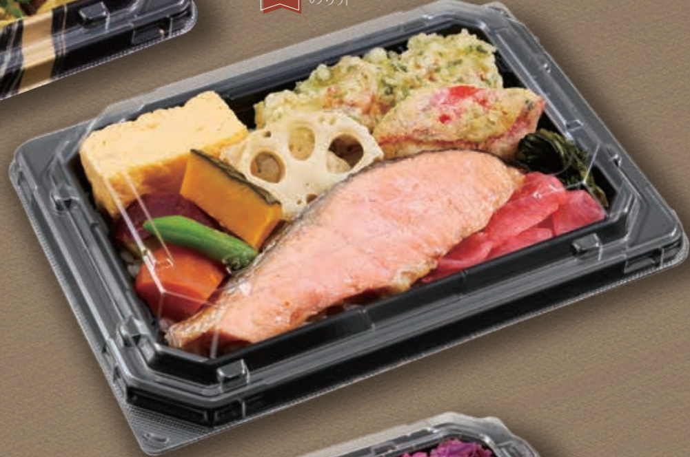
NEW CT宝台膳 18-13 BK のり弁