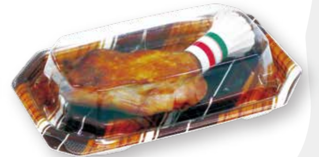
TP デリグー 20-13 パウム BR チキンレッグ