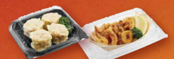
ワンバックシリーズ