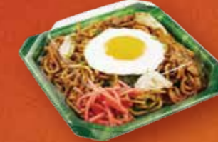
TP デリグーシリーズ