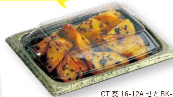
CT 葵 16-12A せとBK-BK / 高蓋 大学芋