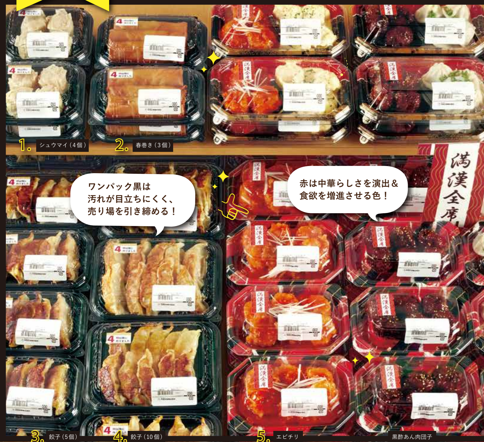
1. シュウマイ (4個) 2. 春巻き (3個)