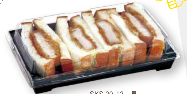
SKS 20-12 黒 カツサンド