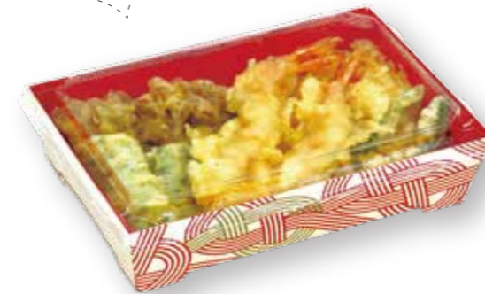
SKS17-12(43) 赤 - 水引 / 浅蓋 天ぷら盛り合わせ