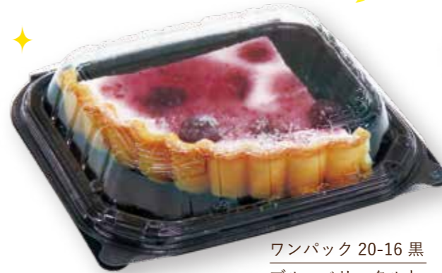
ワンパック 20-16 黒 ブルーベリータルト