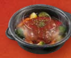
BAKEQ AIR シリーズ