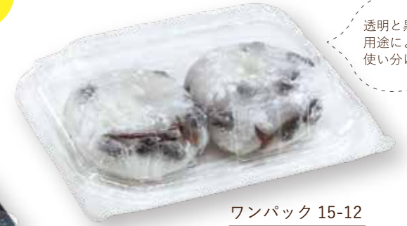
ワンパック 15-12 豆大福