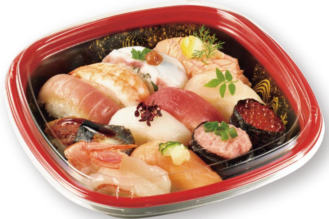
にぎり寿司 美軽角桶 1 花泉 R-黒