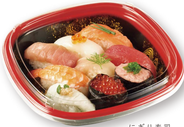
にぎり寿司 美軽角桶 0.8 花泉 R-黒